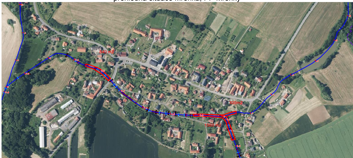
přehledná situace Mřenka, PP Mřenky